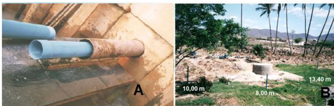
Foto 1 - (A) Processo de instalação dos drenos radiais; (B) Extensões alcançadas pelos drenos em um exemplo real (Brejo da Madre de Deus - PE)

formando poços de 3 metros de diâmetro e alta produtividade (fotos 2, A e B).