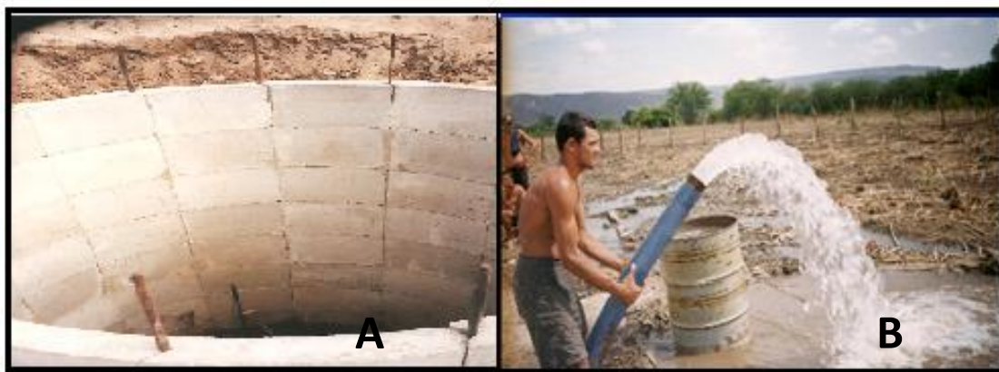
Foto 2 – (A) Blocos de concreto articulados para construção do poço (B) Alta produtividade dos poços com drenos radiais. Exu - PE

desses tubos é instalada sapata cortante em aço carbono 1040, com tratamento térmico para minimizar o desgaste. O conjunto tubos e sapata é inserido horizontalmente no poço com o auxílio de um cilindro hidráulico de alta potência, até que os esforços envolvidos impeçam o avanço. Após isso, o material acumulado no interior dos tubos de 6.5/8” é removido, por injeção de água a alta pressão, em volume suficiente para o completo carreamento dos finos (foto 3, A e B).