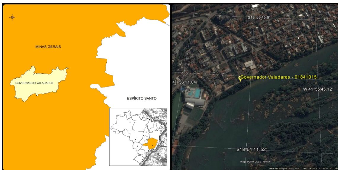
Figura 01 – Localização do Município e da Estação Pluviográfica.

Este relatório apresenta a Equação IDF para o município de Governador Valadares desenvolvida pela COPASA-Companhia de Saneamento de Minas Gerais e divulgada através da publicação Freitas (2001). Os dados para definição da equação IDF foram obtidos no 5º DISME (Belo Horizonte). A Figura 01 apresenta a localização do município e da estação.