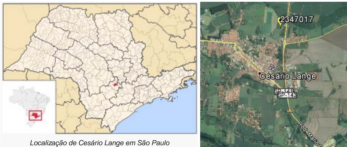
Figura 01 – Localização do Município e da Estação Pluviométrica.

A Estação Cesário Lange, Código ANA 02347017 (Código DAEE-SP E4-049), está localizada na Latitude 23°13'00"S e Longitude 47°57'00"W (segundo o inventário da ANA), no município de Cesário Lange/SP. Esta estação pluviométrica é de responsabilidade e operação do DAEE-SP. Os dados para definição da equação IDF foram obtidos a partir dos dados diários de precipitação. A Figura 01 apresenta a localização do município e da estação.