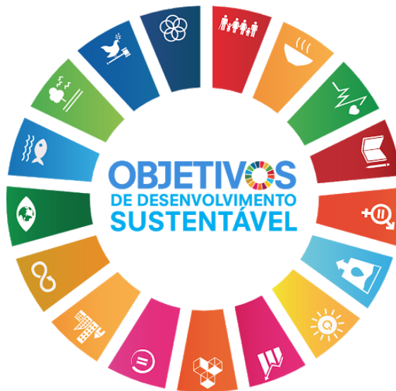
Figura 1 - Objetivos de desenvolvimento sustentável.

Ressalta-se ainda que este estudo está em consonância com os Objetivos do Desenvolvimento Sustentável 2 (Figura 1) e com o marco pós-2015 para a redução de riscos de desastres, também conhecido como Marco de Sendai 3 .