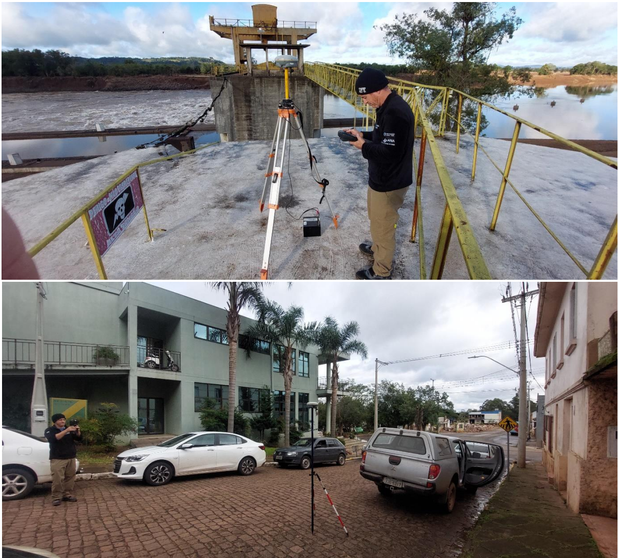
Figura 7. Base do rastreamento na eclusa de Bom Retiro do Sul / RS e rastreamento na cidade.

A cota nivelada pela equipe de hidrologia do SGB, no distrito de Mariante, às margens do rio Taquari próximo à rodovia RS-287, pertencente ao município de Venâncio Aires / RS, na estação fluviométrica Porto Mariante (86895000), foi de exatos 20,50 m.