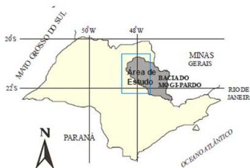
Figura 1 – Localização da área de estudo

A área de estudo está localizada na porção paulista do flanco sudeste da Bacia do Paraná e restringe-se a uma pequena parte do aquífero Guarani. Está situada entre os paralelos 20°45' e 22°15' de latitude sul e os meridianos 47°30' e 48°30' de longitude oeste, englobando os limites da bacia hidrográfica Mogi-Pardo na sua porção médio-baixa (Figura 1). As águas estudadas pertencem ao sistema aquífero Guarani, o qual consiste de arenitos eólico-flúvio-lacustres, em sua maior parte confinados por basaltos.