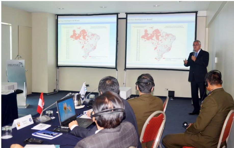
Foto 5 - Apresentação do representante da CPRM - Serviço Geológico do Brasil