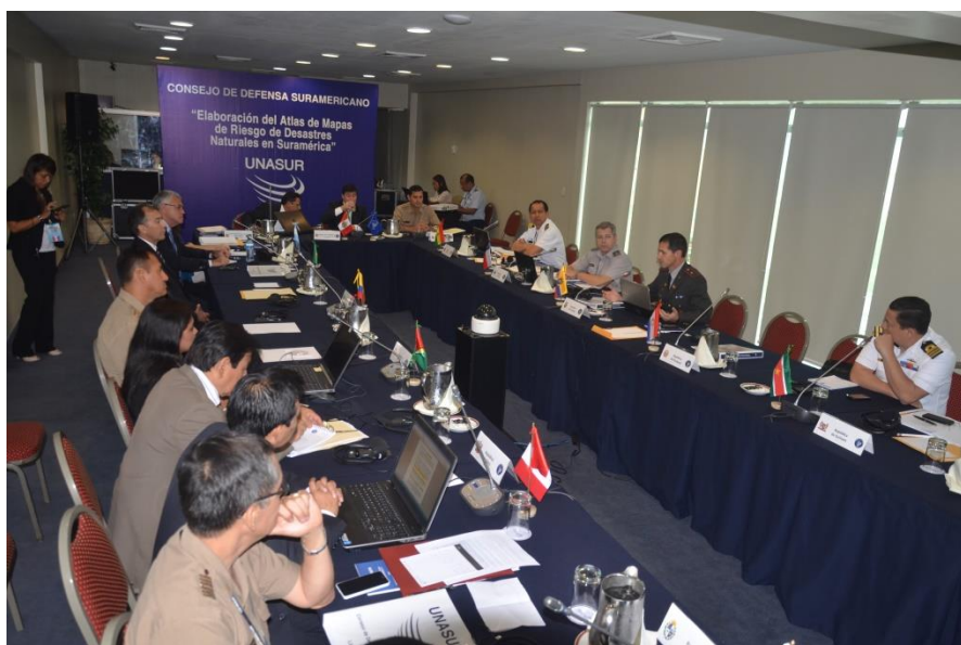
Foto 4 - Mesa de trabalho com os representantes dos países-membros na reunião CDS-UNASUL