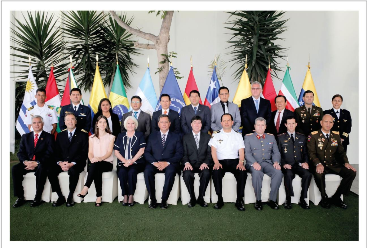
Foto 6 - Delegações participantes da Reunião do CDS/UNASUL para a elaboração do Atlas de Mapas de Risco de Desastres Naturais