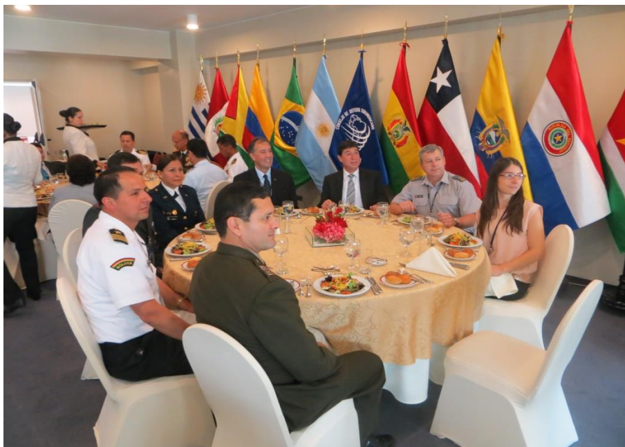
Foto 5 - Almoço durante o evento com membros das delegações do Peru, Brasil, Argentina, Equador e Bolívia em uma das mesas.