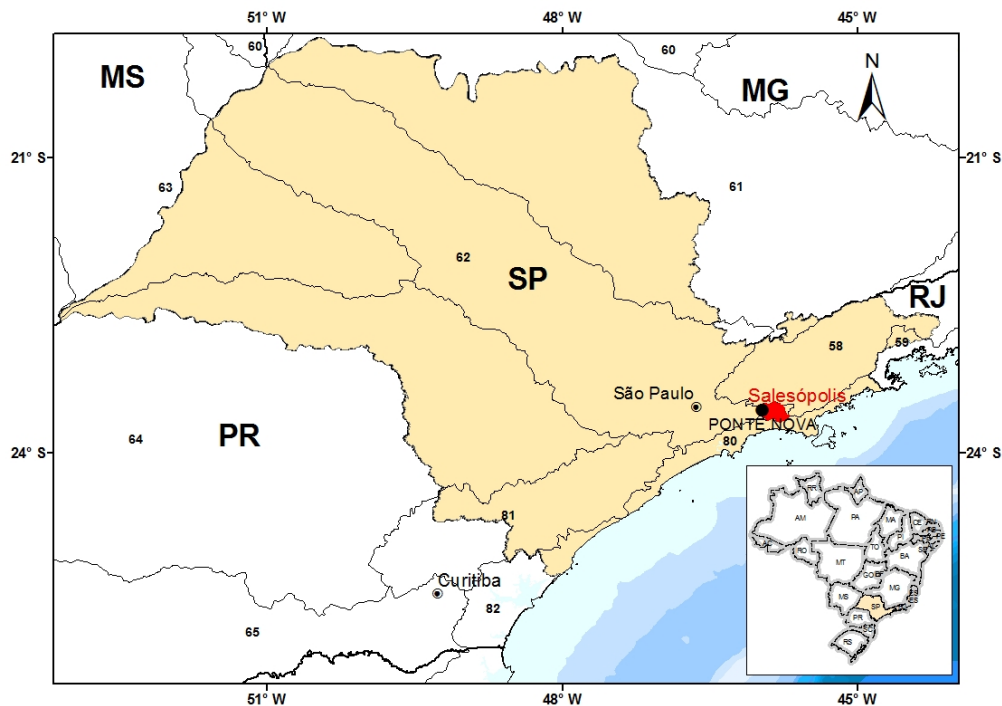
Figura 01 – Localização do Município e da Estação Pluviográfica.

A Figura 01 apresenta a localização do município e da estação.