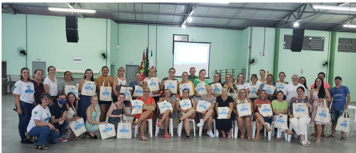
Figura 2 - Turma Vespertino de professores da ação pedagógica em Siderópolis – SC.