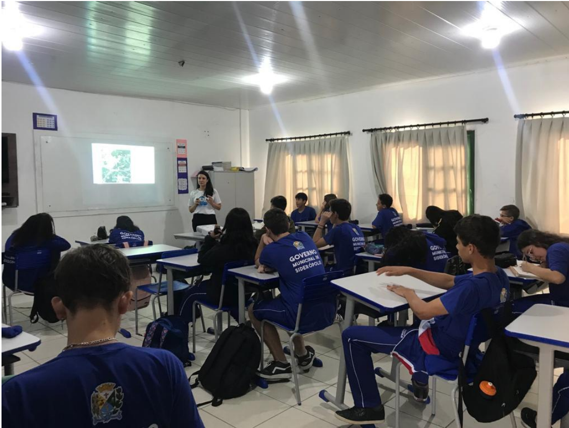
Figura 5: Turma do 8º ano da escola Lazarin durante a palestra realizada pela equipe do PEA (SGB, 2023).