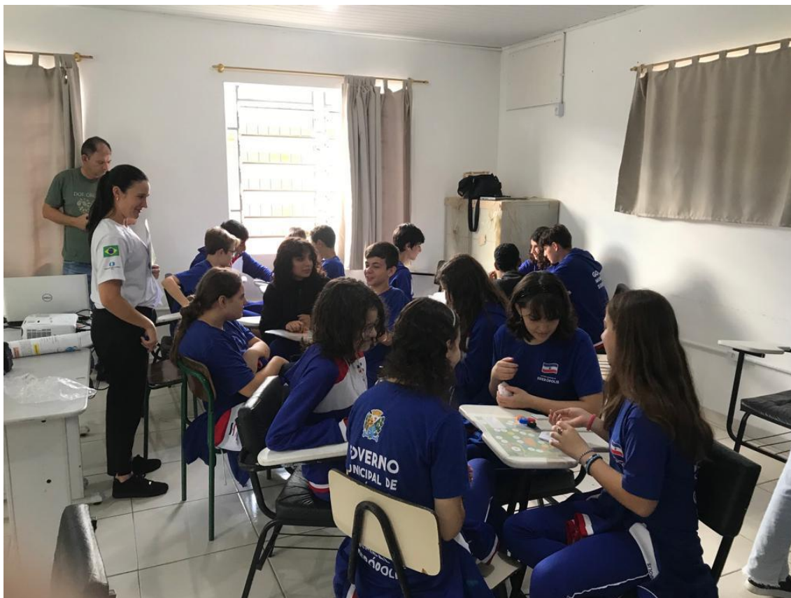
Figura 6: Turma do 8º ano da escola Jorge Bif jogando o jogo de tabuleiro da Bacia Carbonífera de Santa Catarina (SGB, 2022).