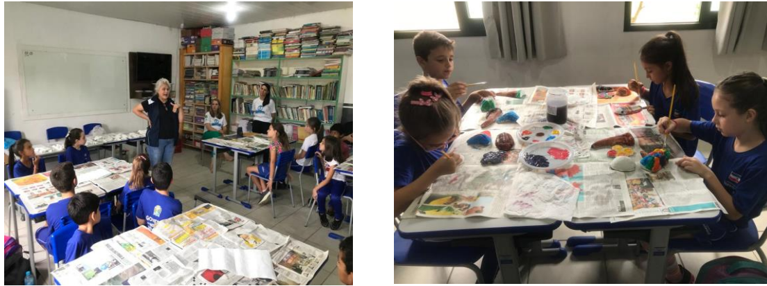
Figura 4: Turma durante a oficina de réplicas de fósseis na EEBM Miguel Lazzarin (SGB, 2023).