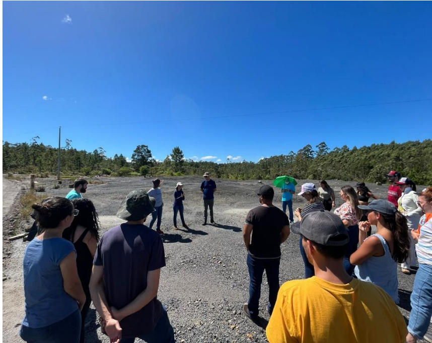
Figura 7: Turma da disciplina de Poluição do solo, do Programa de Pós-Graduação em Ciência do solo e Ciência ambientais, da UDESC/Lages acompanhada de colaboradores do NUMA (SGB, 2023).