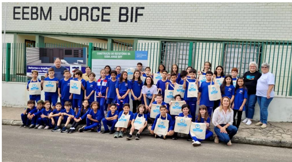
Figura 3: Turmas do 4 o e 5 o ano do ensino fundamental da Escola Municipal Jorge Bif em Siderópolis – SC com o diretor da escola e a equipe do SGB (Secretaria da EEBM Jorge Bif, 2023).