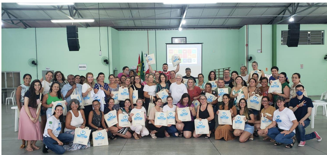
Figura 1 - Turma Matutino de professores da ação pedagógica em Siderópolis – SC