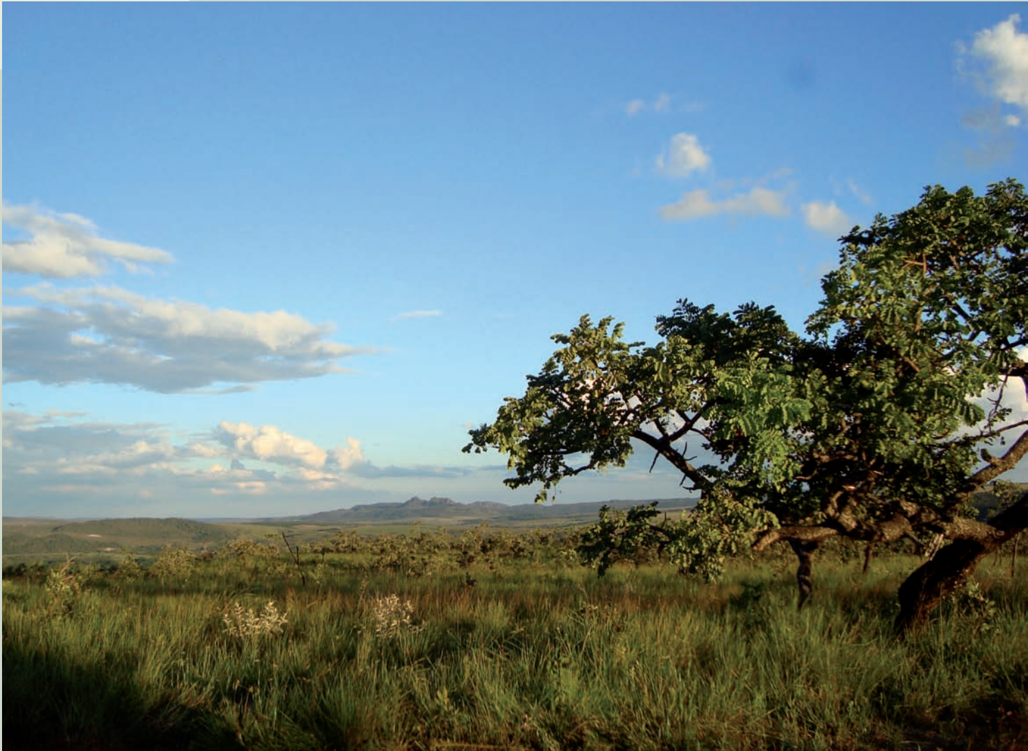
Paisagem do bioma Cerrado mostrando ao fundo as cristas da serra dos Pirineus, Planalto Central, Goiás.