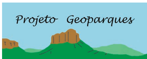
Figura 2 - Logomarca do Projeto Geoparques baseada em uma gravura da Chapada Diamantina, Bahia, de Orville A. Derby (1906).

Dados adicionais: A criação do geoparque fomentará atividades de desenvolvimento sustentável das populações locais, promoverá a preservação de cachoeiras e cavernas