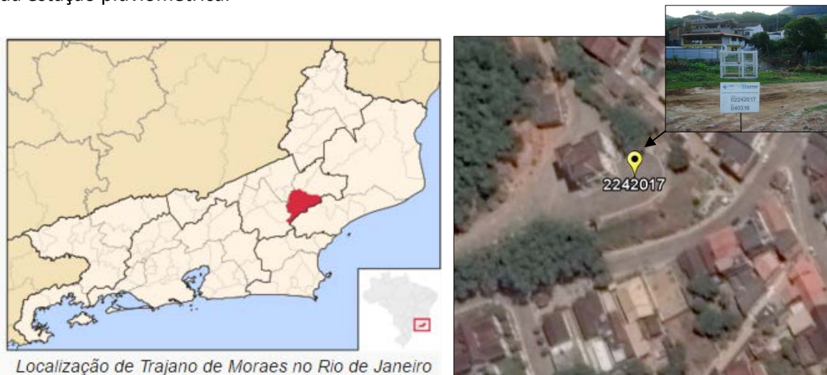
Figura 01 – Localização do Município e da Estação Pluviométrica.

A estação Visconde de Imbé, código 02242017, está localizada na Latitude 22°04'04"S e Longitude 42°09'36"W. Esta estação pluviométrica encontra-se em atividade desde 1965, sendo atualmente operada pelo Serviço Geológico do Brasil (SGB/CPRM). Os dados para definição da equação IDF foram obtidos a partir dos dados diários de precipitação coletados em pluviômetro modelo padrão DNAEE. A Figura 01 apresenta a localização do município e da estação pluviométrica.