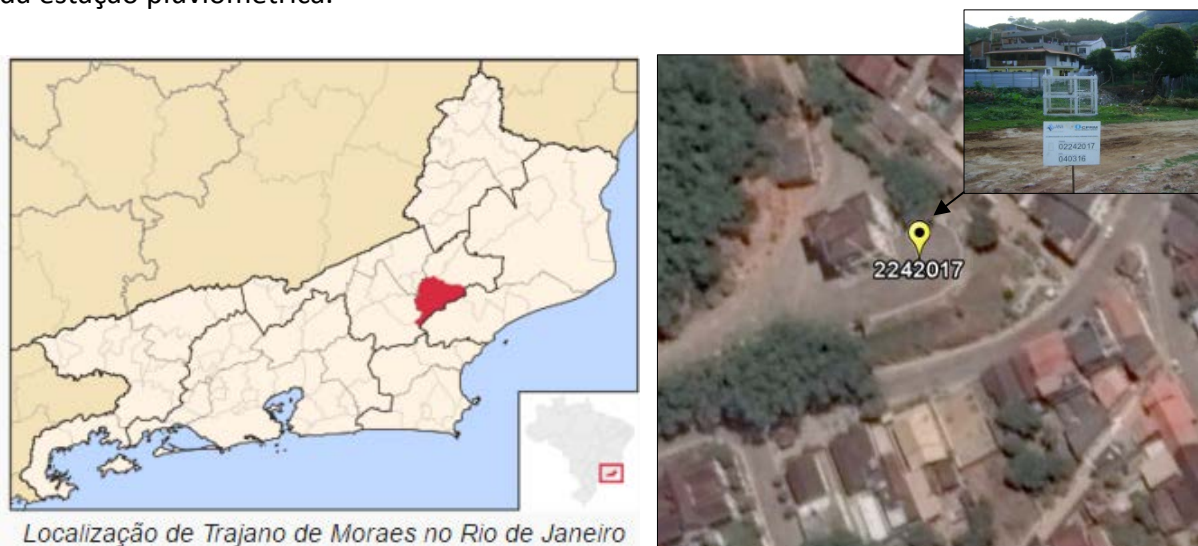
Figura 01 – Localização do Município e da Estação Pluviométrica.

A estação Visconde de Imbé, código 02242017, está localizada na Latitude 22°04'04"S e Longitude 42°09'36"W. Esta estação pluviométrica encontra-se em atividade desde 1965, sendo atualmente operada pelo Serviço Geológico do Brasil (SGB/CPRM). Os dados para definição da equação IDF foram obtidos a partir dos dados diários de precipitação coletados em pluviômetro modelo padrão DNAEE. A Figura 01 apresenta a localização do município e da estação pluviométrica.