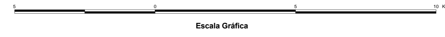
MAPA DE PONTOS D'ÁGUA 2003