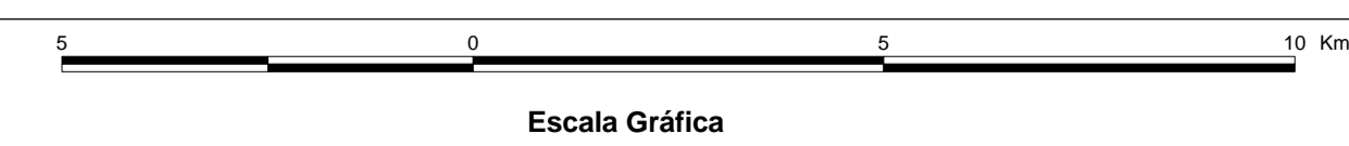
MAPA DE PONTOS D'ÁGUA 2003