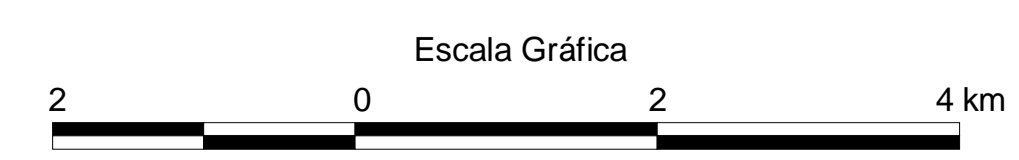
MAPA DE PONTOS D'ÁGUA 2003