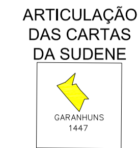
LOCALIZAÇÃO DO MUNICÍPIO DE LAJEDO - PE