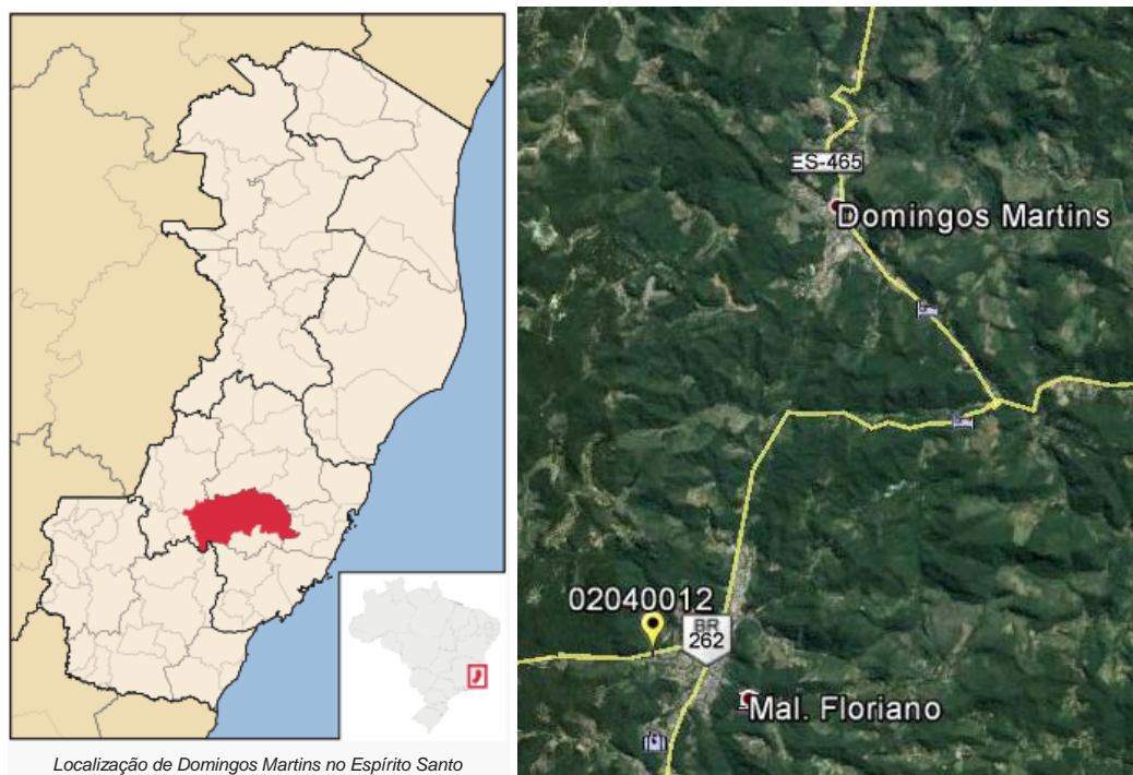
Figura 01 – Localização do Município e da Estação Pluviométrica.

A Estação Marechal Floriano (DNOS), Código ANA 02040012, está localizada na Latitude 20°24'43"S e Longitude 40°40'56"W (segundo o inventário da ANA), no município de Marechal Floriano/ES. Esta estação pluviométrica é de responsabilidade da ANA e operação pela CPRM. Os dados para definição da equação IDF foram obtidos a partir dos dados diários de precipitação. A Figura 01 apresenta a localização do município e da estação.