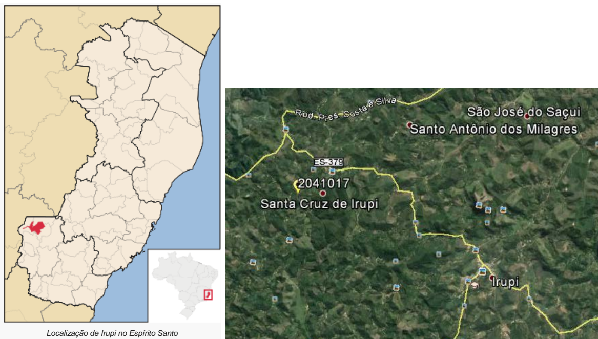
Figura 01 – Localização do Município e da Estação Pluviométrica.

A Estação Santa Cruz – Caparaó, Código ANA 02041017, está localizada na Latitude 20°19'22"S e Longitude 41°42'15"W (segundo o inventário da ANA), no município de Irupi/ES. Esta estação pluviométrica é de responsabilidade da ANA e operada pela CPRM. Os dados para definição da equação IDF foram obtidos a partir dos dados diários de precipitação. A Figura 01 apresenta a localização do município e da estação.