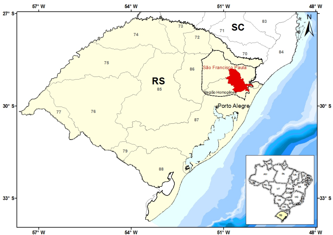
Figura 01 – Localização do Município e da Região Homogênea

A Figura 01 apresenta a localização do município de São Francisco de Paula e a delimitação da região homogênea, cuja equação subsidiou a elaboração da IDF do município de São Francisco de Paula.