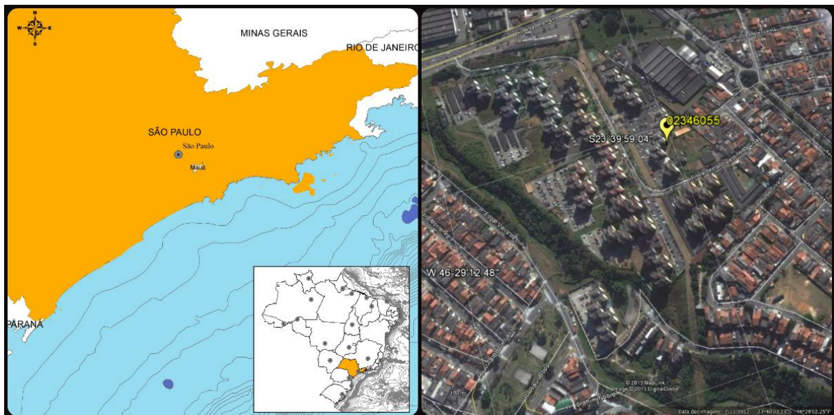
Figura 01 – Localização do Município e da Estação Pluviográfica

A Figura 01 apresenta a localização do município e da estação.