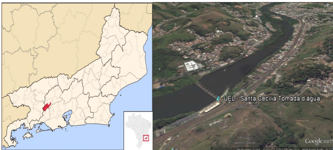
Figura 01 – Localização do Município e da Estação Pluviométrica.

A Estação UEL - Santa Cecília Tomada d'água, Código LIGHT 02243205, está localizada na Latitude 22°28'55"S e Longitude 43°50'21"W, dentro do município de Barra do Piraí/RJ. Essa estação pluviométrica encontra-se em atividade desde 1920, sendo atualmente operada pela LIGHT. A Figura 01 apresenta a localização do município e da estação.