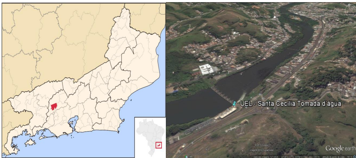
Figura 01 – Localização do Município e da Estação Pluviométrica.

A Estação UEL - Santa Cecília Tomada d'água, Código LIGHT 02243205, está localizada na Latitude 22°28'55"S e Longitude 43°50'21"W, dentro do município de Barra do Pirai/RJ. Essa estação pluviométrica encontra-se em atividade desde 1920, sendo atualmente operada pela LIGHT. A Figura 01 apresenta a localização do município e da estação.