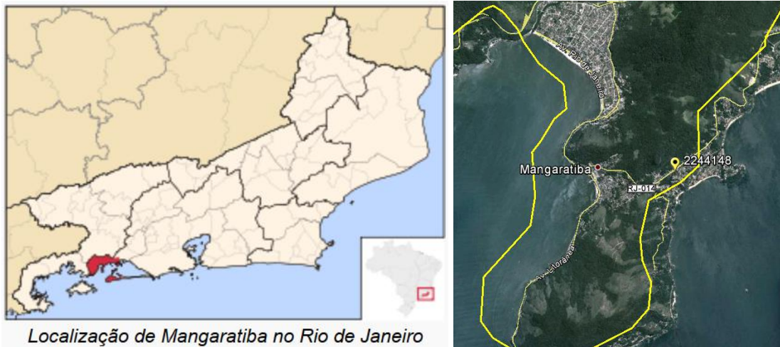
Localização de Mangaratiba no Rio de Janeiro

A Estação Ibicuí, código 02244148, está localizada na Latitude 22°57'41.04"S e Longitude 44°01'50.16"O, no próprio município de Mangaratiba, nas proximidades da RJ-014. Esta estação pluviométrica continua em atividade, sendo operada pela CPRM. Os dados para definição da equação IDF foram obtidos a partir dos dados diários de precipitação coletados em pluviômetro modelo Ville de Paris. A Figura 01 apresenta a localização do município e da estação.