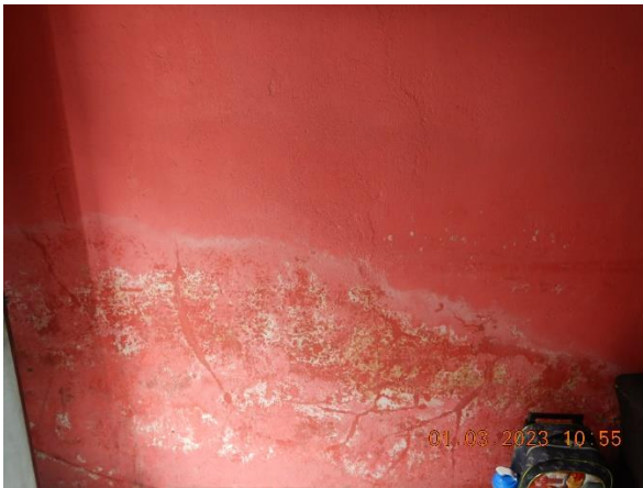
Figura 5.7 Infiltração de água nas paredes