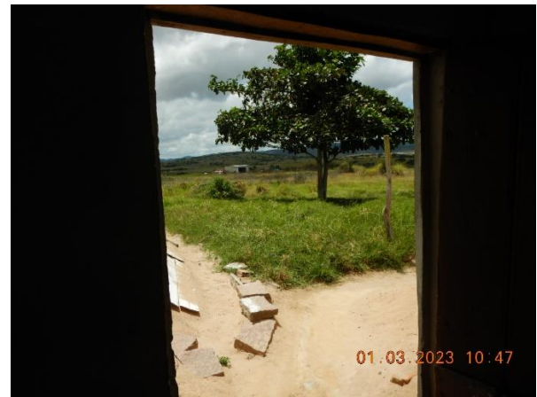
Figura 5.2 : Vista do terreno dos fundos da residencia