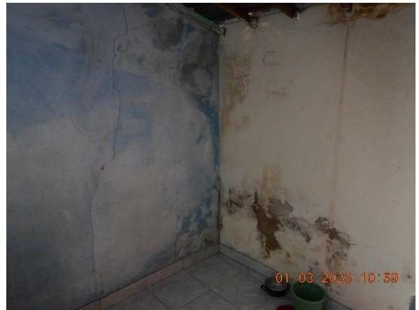
5.8: Infiltração de água nas paredes