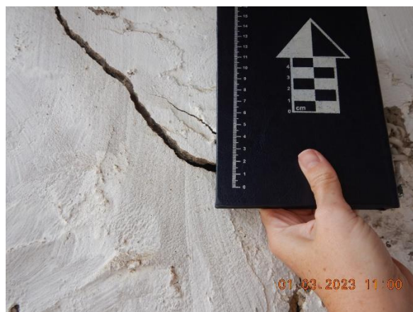
Figura 5.11: Rachadura interna aberta na residência. Figura 5.12: Rachadura aberta em muro

Fotos do terreno dos fundos das casas e da rua: