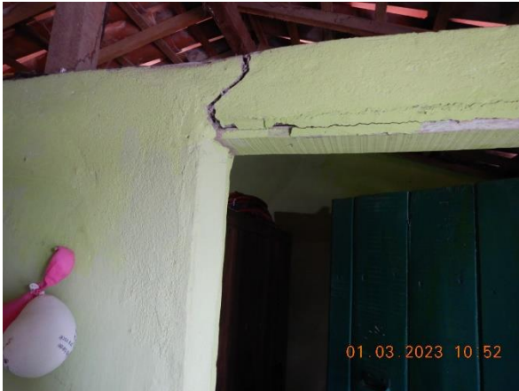
Figura 5.5: Rachadura interna