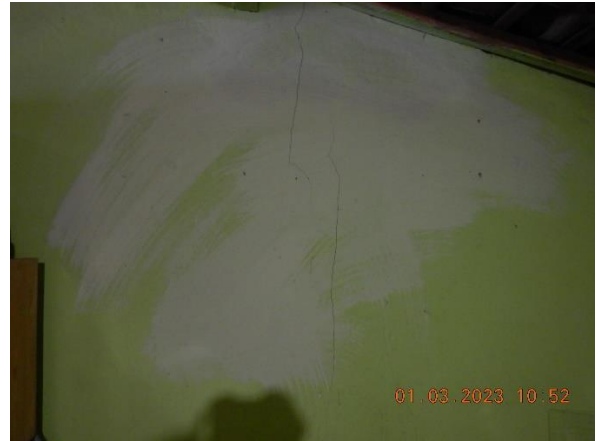
Figura 5.6: Trinca na parede