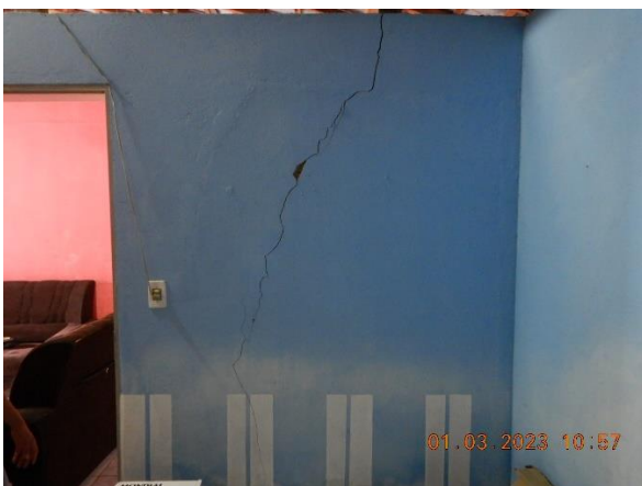
Figura 5.9: Rachaduras internas