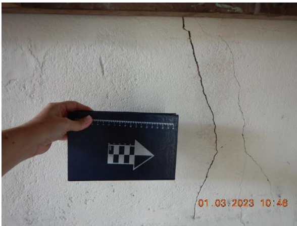
Figura 5.1: Rachadura interna