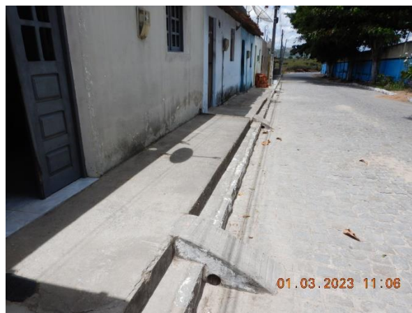
Figura 5.13 Terreno plano no fundo das residências. Figura 5.14: Sistema de drenagem da rua