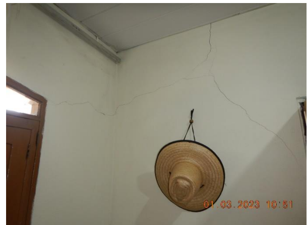
Figuras 5.3 e 5.4: Trincas nas paredes da residência de número 60 de possível causa construtiva