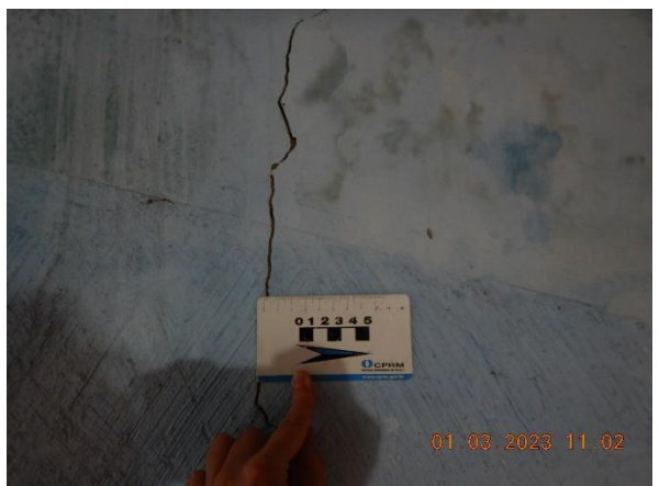
Figura 5.10: Rachaduras internas