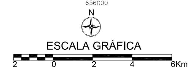
MAPA DE PONTOS D'ÁGUA 2005