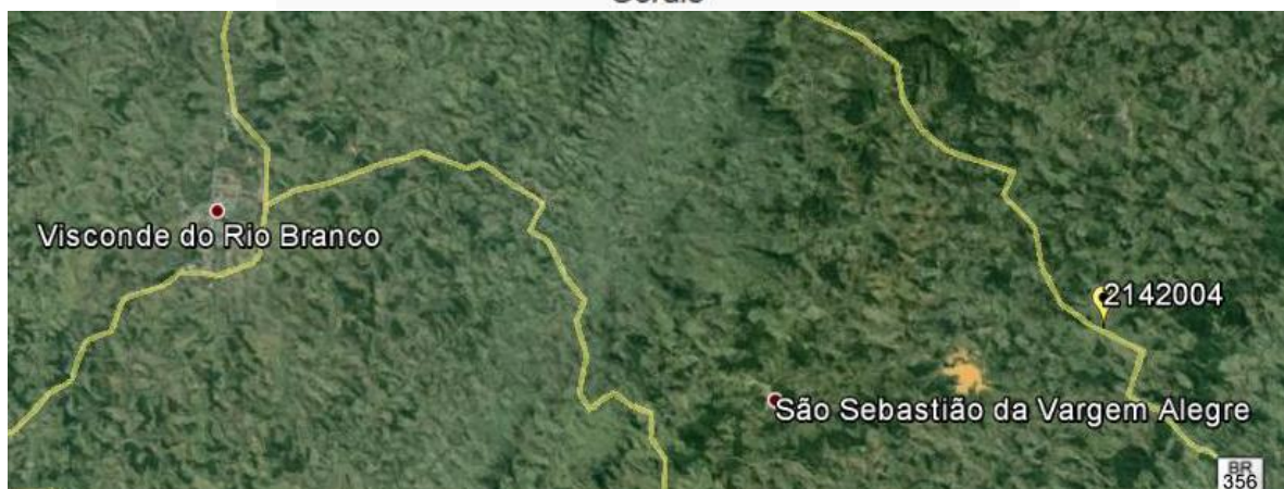
Figura 01 – Localização do Município e da Estação Pluviométrica. (Fontes: Wikipédia e Google, 2014)