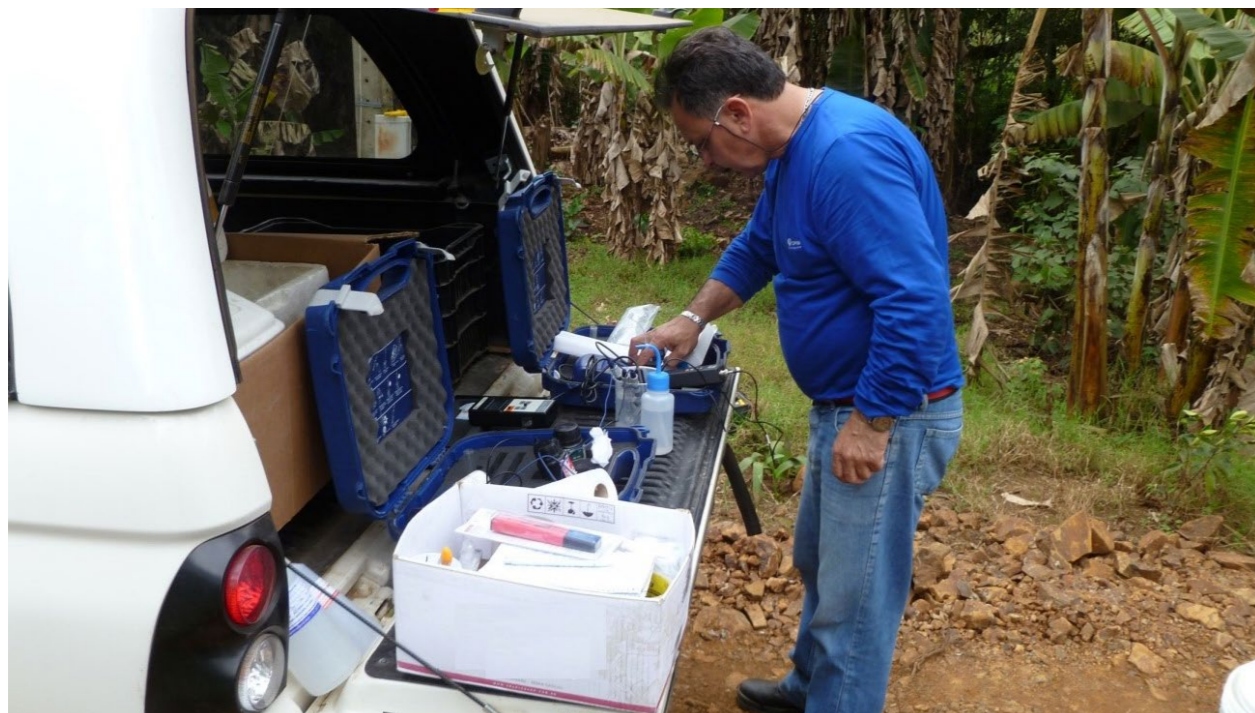
Figura 4.2 - Sondas multiparamétricas para medição in loco dos parâmetros físico-químicos das águas subterrâneas.

A partir dos dados obtidos do cadastramento dos poços tubulares, o SGB-CPRM irá apresentar manual sobre a forma de perfuração, operação e manutenção de poços tubulares profundos para exploração das águas subterrâneas nos sistemas aquíferos presentes no município de Joinville, que deverá ser entregue em meio digital.