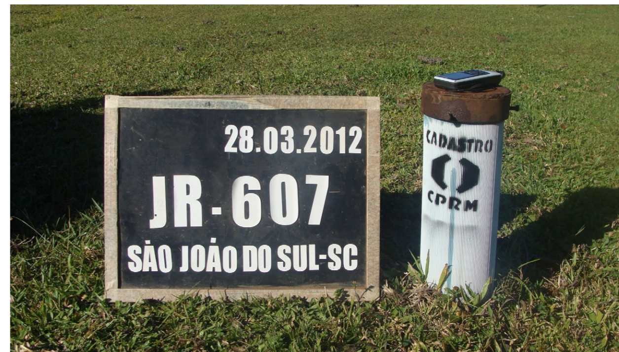
Figura 4.1 - Exemplo de identificação de poço cadastrado pelo SGB-CPRM.

Se os proprietários dos poços permitirem, estes serão identificados com etiquetas à prova de intempéries, contendo uma sigla e o indicativo de que o poço foi cadastrado pelo SGB-CPRM no âmbito do Projeto (Figura 4.1). Durante o cadastramento em campo dos poços e nascentes serão, desde que possível, realizadas medidas in loco (Figura 4.2), por meio de equipamentos portáteis (medidores de nível e sondas multiparamétricas), dos seguintes parâmetros: nível da água, pH, condutividade elétrica e temperatura das águas subterrâneas.