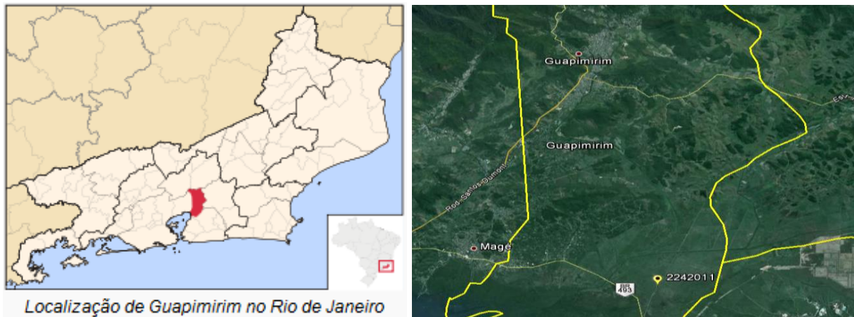
Figura 01 – Localização do Município e da Estação Pluviométrica. (Fontes: Wikipédia e Google, 2013)

A Estação de Bombeamento de Inhuma, código 02242011, está localizada na Latitude 22°40'49.08"S e Longitude 42°56'56.04"W, no próprio município de Guapimirim, nas proximidades da BR-493. Esta estação pluviométrica continua em atividade, sendo operada pela CPRM. Os dados para definição da equação IDF foram obtidos a partir dos dados diários de precipitação coletados em pluviômetro modelo Ville de Paris. A Figura 01 apresenta a localização do município e da estação.