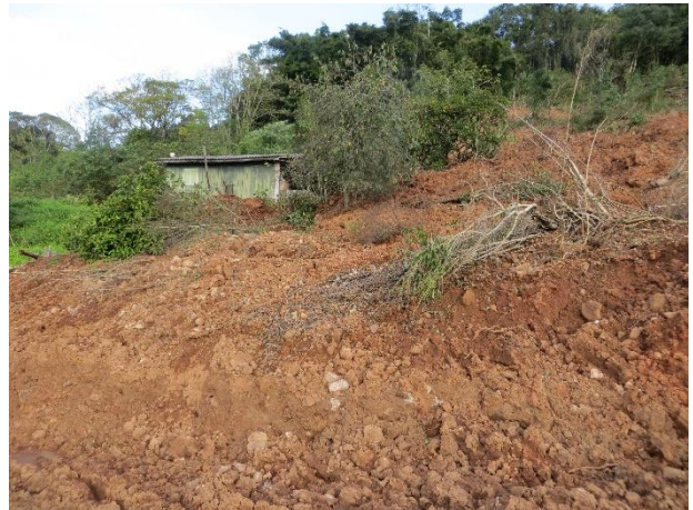
Figura 11 – Aspecto do deslizamento planar com risco remanescente.