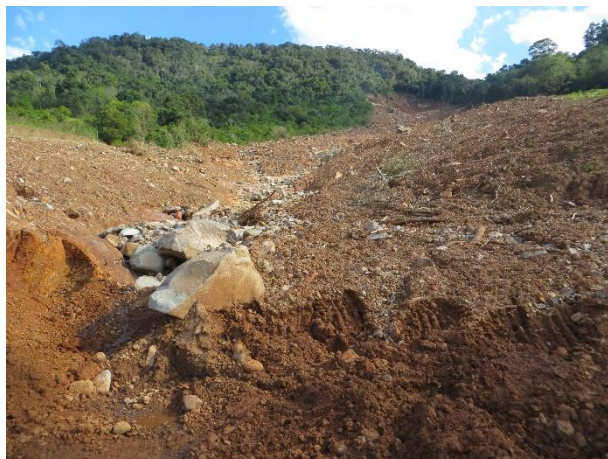
Figura 8 – Aspecto geral do processo de corrida.