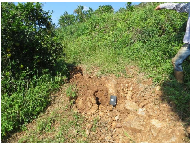
Figura 4 – Degrau de abatimento em processo de rastejo de depósito coluvionar.