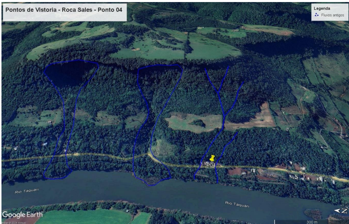
Figura 12 – Ponto P04. Encosta com escarpa basáltica seguida por depósitos coluvionares, com feições de fluxos antigos. Ocorrência de deslizamento planar no ponto vistoriado, com risco remanescente para uma residência.

Neste local foram deflagrados deslizamentos planares de pequeno porte, em encosta íngreme, formada por escarpas basálticas, seguidas por depósitos coluvionares. Na figura 12, visualizam-se feições que sugerem a ocorrência de antigos fluxos gravitacionais de massa, originados na escarpa e terminados no leito do Rio Taquari. Os deslizamentos planares observados ocorreram no dia 02/05/2024, sobre solos coluvionares, desenvolvendo um fluxo de água que interceptou uma residência. Recomenda-se a remoção da residência, devido a presença de risco remanescente de deslizamento planar e possibilidade de deflagração de fluxos de grande porte iniciados na escarpa adjacente (Figuras 09, 10, 11, 12 e 13).