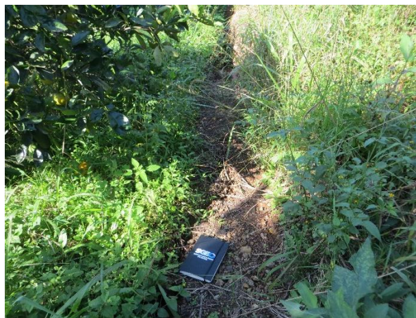
Figura 5 – Degrau de abatimento em processo de rastejo de depósito coluvionar.