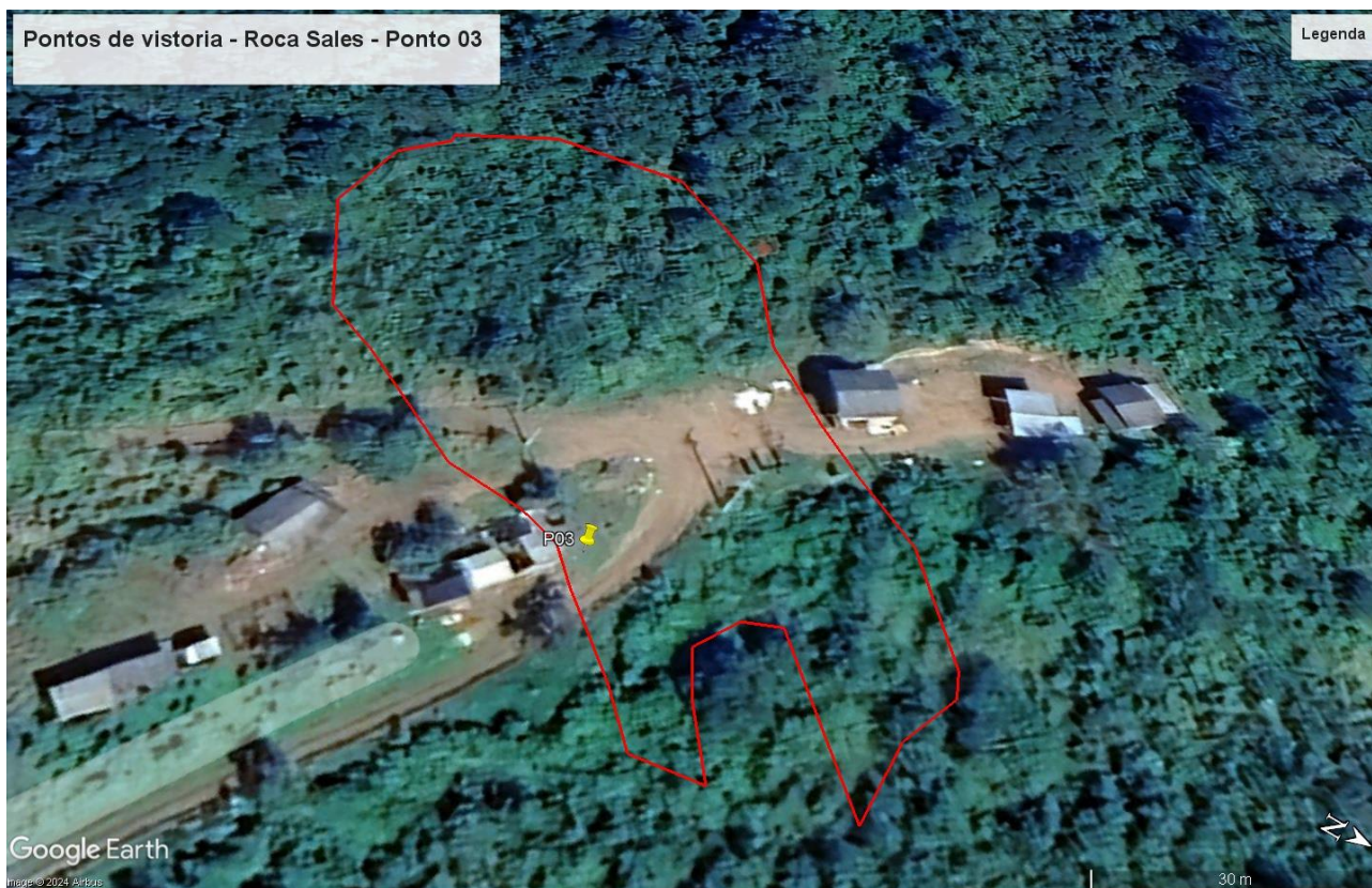
Figura 09 – Ponto P03. Processo de deslizamento planar instalado em encosta íngreme, afetando via e duas residências em área rural na localidade de Morro Mariano.

Ocorrência de deslizamento planar em encosta íngreme, formada por solos residuais/coluvionares. O evento foi registrado no dia 02/05/2024. O movimento de massa atingiu a lateral de uma casa e no local ainda existem duas edificações sob risco remanescente, conforme evidenciado pela presença de degraus de abatimento. Recomenda-se a interdição das residências ou a desocupação durante eventos de chuva (Figuras 09, 10 e 11).