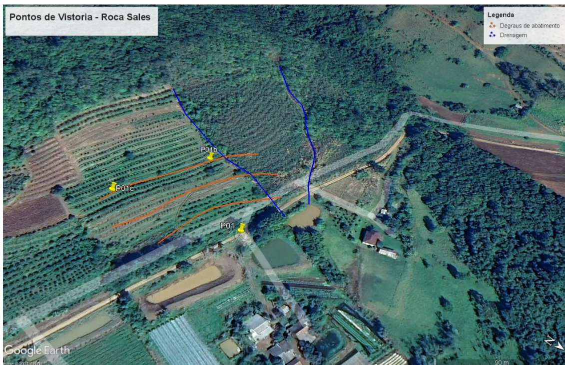
Figura 3– Ponto P01. Processo de rastejo instalado em encosta, atingindo vias, com risco remanescente para casas em área rural na Localidade de Linha Fernando Abbott. Imagem Google Earth.

As chuvas registradas no período iniciaram um processo de rastejo em solos coluvionares da Formação Serra Geral, em encosta íngreme, que atingiu a via e apresenta risco remanescente à algumas casas em área rural. Segundo informações coletadas em campo, o rompimento foi registrado no dia 02/05/2024 (Figuras 3, 4 e 5).