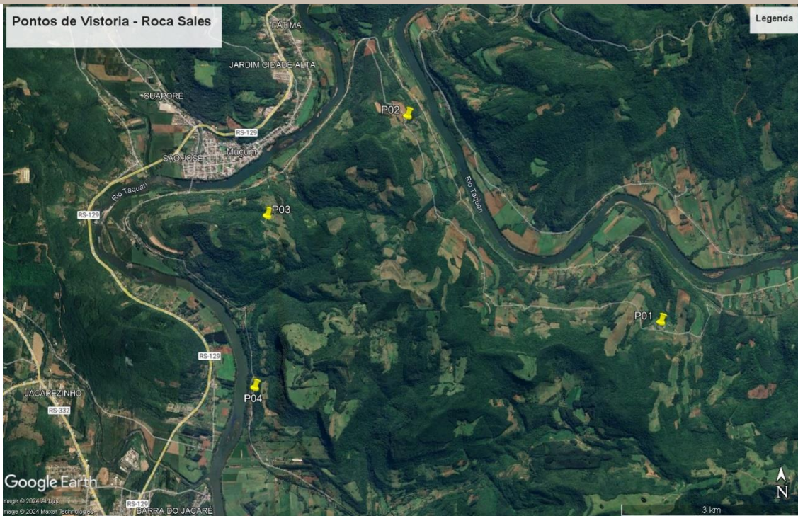
Figura 2 – Pontos visitados no dia 10/06/2024 no município de Roca Sales – RS.