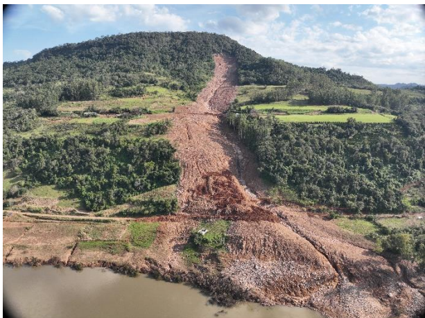
Figura 7 – Vista geral do processo de corrida de lama e detritos.