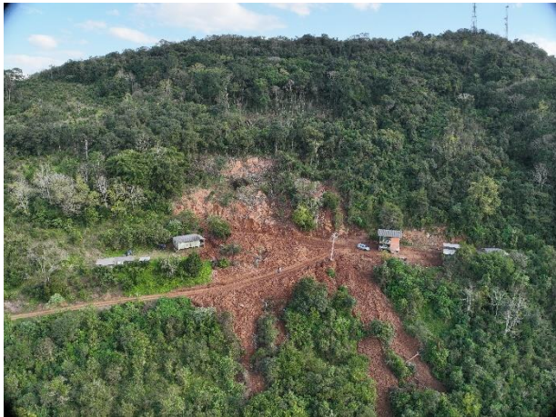
Figura 10 – Deslizamento planar em encosta íngreme com risco remanescente.