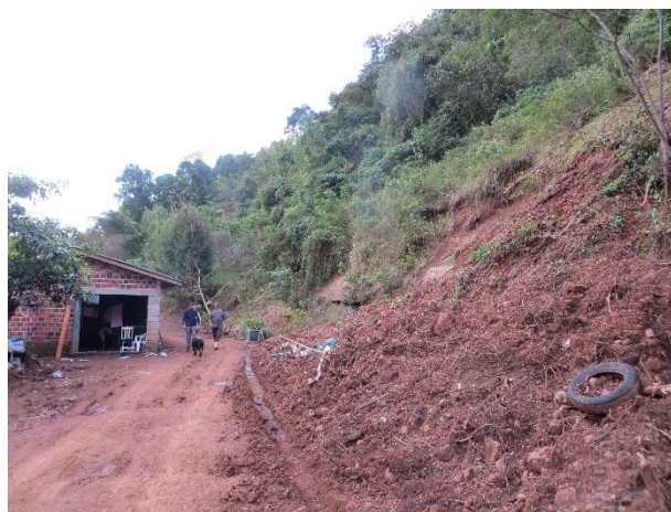
Figura 14 – Deslizamento planar com risco remanescente.