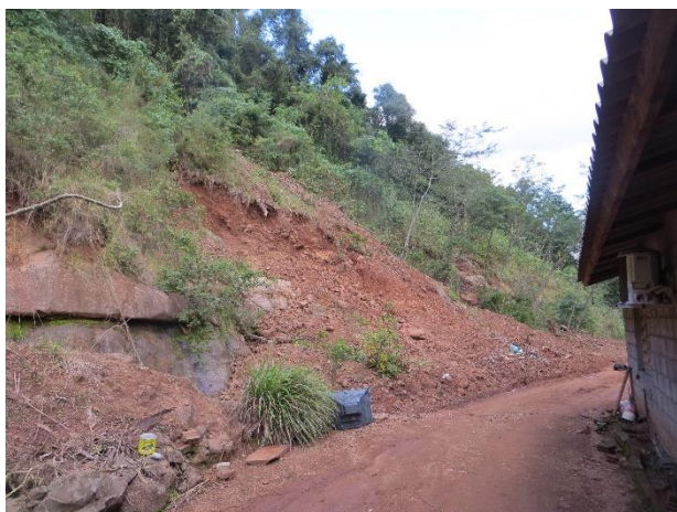
Figura 13 – Deslizamento planar com risco remanescente.